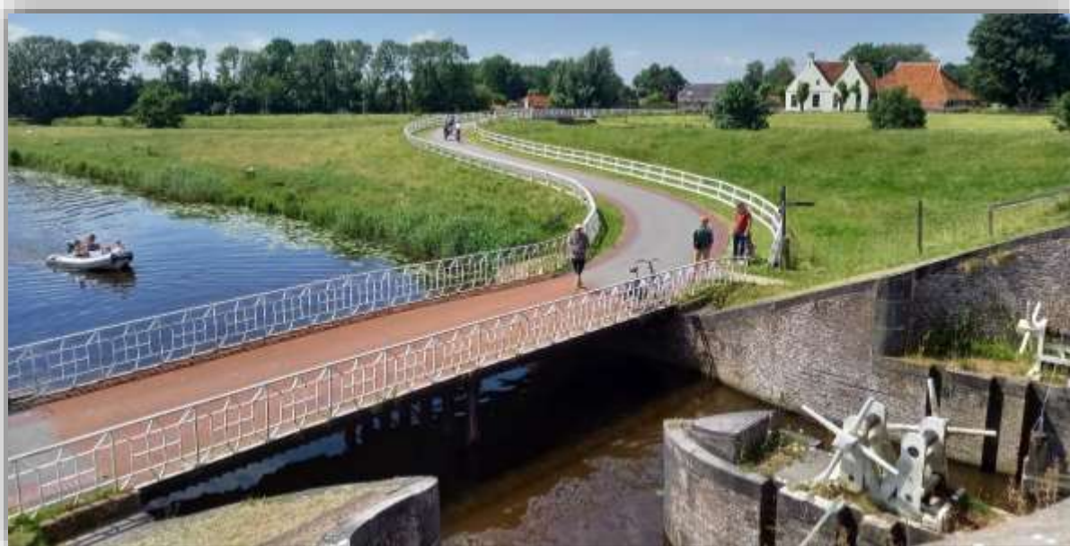
Monumentaal sluizencomplex Aduarderzijl

Stichting Open Monumentendag Gemeente Westerkwartier